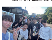
みんなで名古屋を案内!